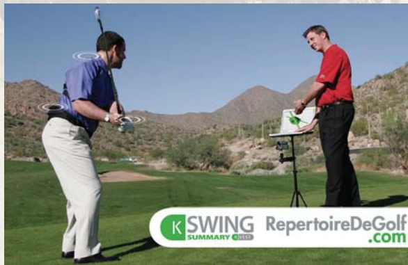
K SWING RepertoireDeGolf.com SUMMARY 3D

Avec ce bijou technologique, nous avons jusqu'à huit prises de vues différentes permettant de voir même les choses invisibles à l'oeil nu.